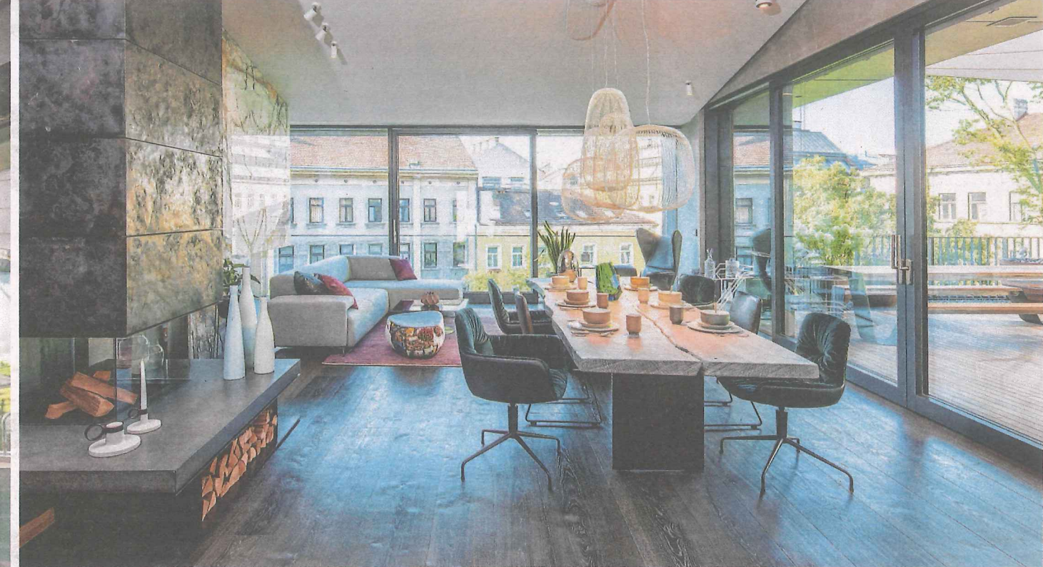
Raumhohe Verglasungen sorgen für Transparenz und unterstützen den Gedanken harmonischer sowie lichtdurchfluteter Raumstrukturen, der Außenraum wird zum Teil des Inneren (links und oben). Zusätzliche Sitzplätze in der Küche wurden hier in Form eines Hochtisches integriert

Das Formdepot, ein Netzwerk von zwölf Professionisten aus verschiedenen Handwerksbereichen, wurde vor Kurzem um einen 400 Quadratmeter großen Dachaufbau erweitert. Das Innere beeindruckt mit einem offenen Raumkonzept, Beton, Holz und Naturstein, die dank unterschiedlicher Anwendungsideen mehrfach eingesetzt wurden. VON ANKICA NIKOLIĆ