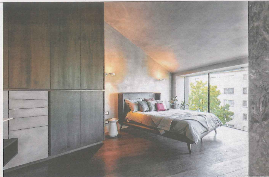
Im Stiegenaufgang erstreckt sich eine Installation aus Raku-Fliesen der Vorarlberger Manufaktur Karak (links). Wände und Decken im Schlafzimmer (oben) wurden mit Pandomo (ein Belag auf Zementbasis) verkleidet, die freistehende Dusche fungiert als raumbildendes Element (unten). Der Küchenblock besteht aus Naturstein (links unten)