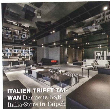
ITALIEN TRIFFT TAIWAN Der neue B&B-Italia-Store in Taipeh

in Peking, Manila und Taipeh eröffnet. Möbel und Küchen von Poliform und Varenna kann man in den neuen Showrooms in Taichung, Taiwan, und Antwerpen bewundern. In der Villa Dada in Ramat haScharon, Israel, werden Traumküchen von Dada präsentiert, in den neuen Stores in Tokio und Singapur die Möbel von Molteni & C.